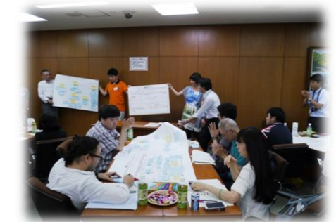
H28.6「区民討議会」の様子