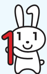
マイナンバーキャラクター「マイナちゃん」

【問合せ】戸籍住民課住民記録係(本庁舎1階) ☎(5273)3601・☎(3209)1728へ。