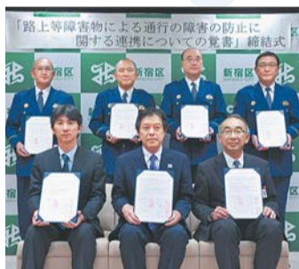
▲条例施行に先立ち、道路管理者、警察署と連携強化に向けた覚書を締結

条例に基づき、駅周辺や繁華街を中心に、地域の皆さんや警察・道路管理者と連携して、路上等障害物による通行の障害の防止に取り組みます。