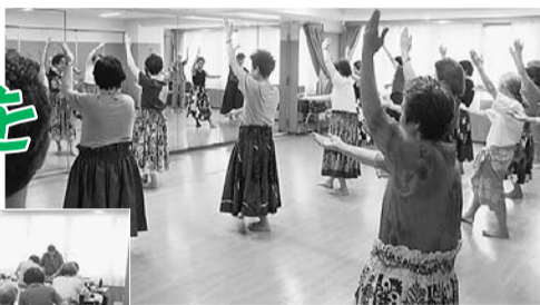
▲フラダンスサークル 講師の指導のもとで練習を重ね、館内 外の舞台上で成果発表をしています。