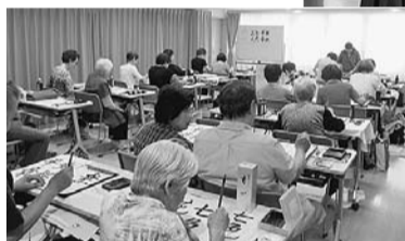
▲書道教室 地域の方を講師に、教室を開いて います。館内で教室参加者の書道 展を開催することもあります。