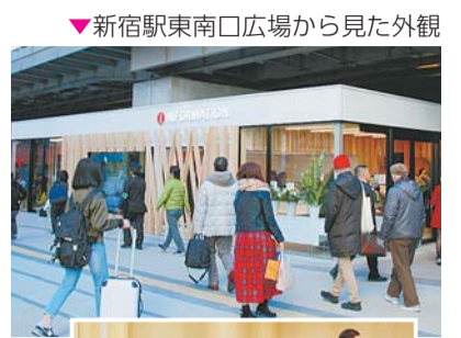
▼新宿駅東南口広場から見た外観

国内外から訪れる方に、多言語での案内やマップの配布等により新宿の多彩な魅力を紹介するほか、観光情報の検索、新宿フリーWi-Fiなどが利用できます。