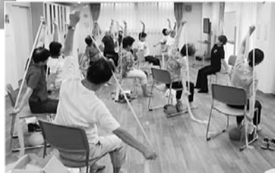
▲筋力向上トレーニング教室 介護予防のための体操教室を開いて います。初心者から取り組めるストレッチ や筋力トレーニングを行っています。

★各館主催の講座等是有料の場合があります。また、清 風園では、集会室を利用する場合は別途400円、新宿区 外にお住まいの方は1人1日当たり700円の施設利用料 が掛かります。