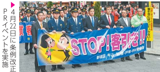
▶4月22日に条例改正PRイベントを実施

客引き行為等の規制を強化し、誰もが安全で安心したまちと感じられるよう、25年9月に施行した条例の一部を改正。区と地域団体などの連携強化や違反行為者への過料等を盛り込み、4月に施行しました(過料等の規定は6月施行)。