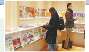
▲マップ・パンフレット等配布コーナー