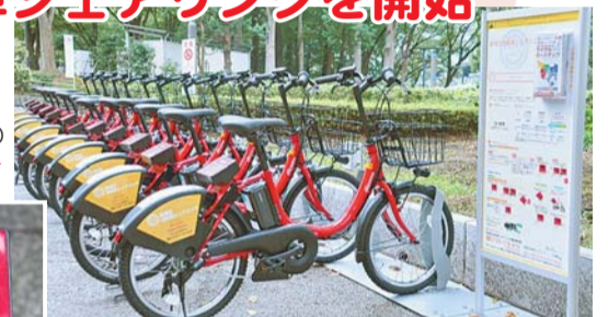
◀自転車の開錠・施錠などはサドル後ろのパネルで操作

区民の新たな移動手段の確保や観光の活性化、まちの回遊性の向上を目指して、10月1日に自転車シェアリングを開始しました。