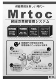
事業紹介パンフレット

鉄道会社向けに保線(線路の保守)・土木システムの企画提案、保守、データの効果的活用支援などを行っています。保線や土木関連のシステムに特化した優れた技術により、多くの鉄道会社から信頼を得ることでシェアを広げ、好調な業績を維持しています。