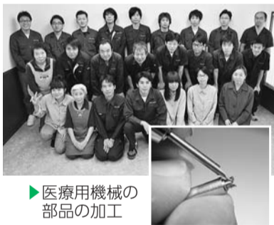
医療用機械の部品の加工

精密機器用の微小切削部品の加工・販売を行い、宇宙・防衛・医療分野へ広く貢献しています。全ての工程が完了するまでの所要期間を大幅に削減する工夫を行い、迅速かつ高い技術力で、大手企業から信頼ある取引先として、確固たる地位を築いています。