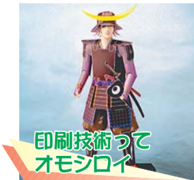
印刷技術ってオモシロイ