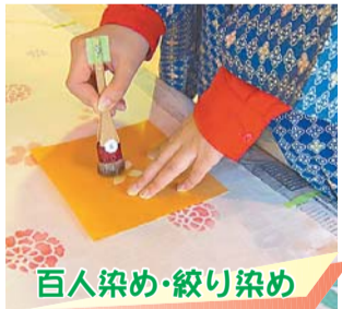
百人染め・絞り染め

百人染め…13日(日)午前10時30分～午後7時・14日(月)午前10時～午後5時(両日とも正午～午後1時を除く) 絞り染め…13日(日)・14日(月)午前10時～12時(13日(日)は午前10時30分から)・午後1時～2時30分・午後3時～5時、各回先着50名 【講師】「染の小道」実行委員会、新宿区染色協議会