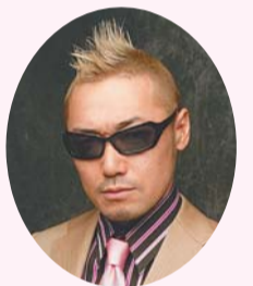
ギューゾウ (電撃ネットワーク)