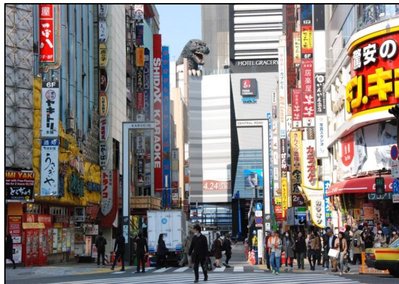
（写真：左はセントラルロード、下はシネシティ広場）