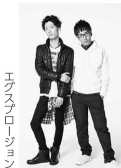
エグスプロージョン

ダンスパフォーマンスや落語、漱石をめぐる文芸好き芸人によるシンポジウムなど ※出演者は都合により変更になる場合があります。