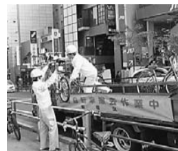
高田馬場駅周辺の撤去作業の様子

が、撤去だけでは問題は解決しません。皆さんのご理解とご協力が何よりも大切です。自転車等で駅まで行く際には路上に放置せず、駅周辺の自転車等駐輪場等を使いましょう。