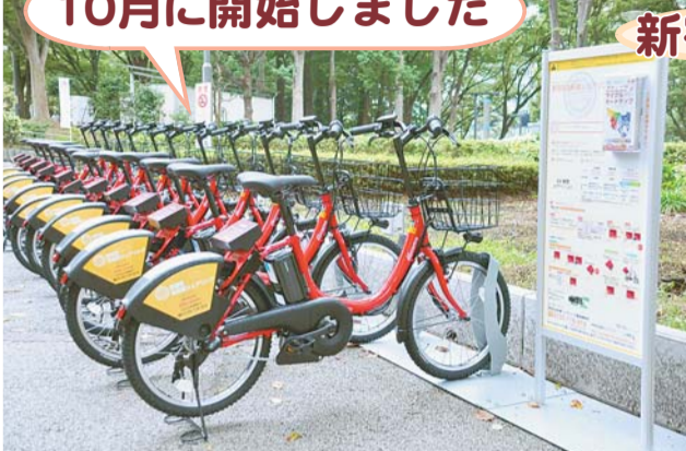
新宿中央公園ポケットパークのサイクルポート