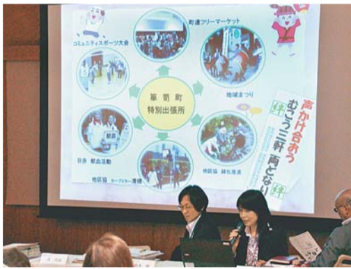
▲▲▲ 区長と意見交換を行います。昨年の様子。地域に沿ったテーマをスライドを使って説明後、