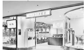
▲イメージ丸の内タニタ食堂外観(本講演の会場とは異なります)

社員食堂のヘルシーメニューで知られ、「おいしくて満腹感がありながらカロリーを抑えた定食」をコンセプトにメニューを提案する(株)タニタ。同社の専属管理栄養士が、健康づくりや健康的なダイエットの方法、毎日の献立に役立つヘルシーレシピのコツをお話します。