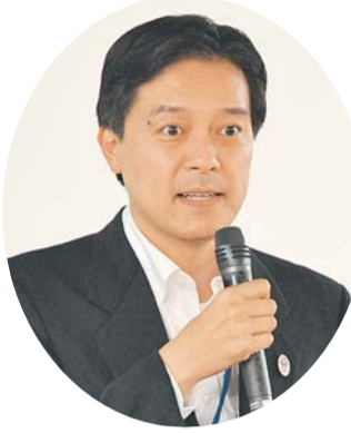
吉住健一 新宿区長

聴覚に障害がある方で「ファックス番号のない記事」へのお問い合わせ・申し込みをご希望の際は、しんじゅくコール☎03(3209)9900をご利用ください。