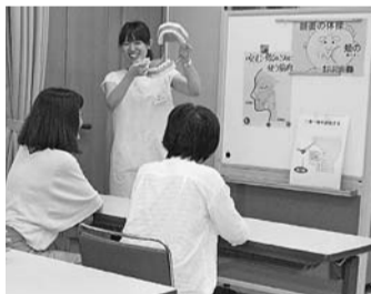
▲教室の開催イメージ