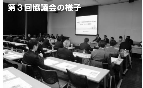
第3回協議会の様子