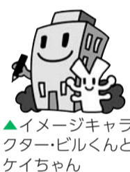
イメージキャラクター ビルちゃんとケイちゃん

総務省・経済産業省が、6月1日を調査期日として、全ての事業所と企業を対象に実施しています。調査票がまだ配布されていない事業所企業の方は、お問い合わせください。調査結果は、社会経済の発展を支える基礎資料として活用されます。統計法により調査内容の秘密は守られます。調査の趣旨をご理解いただき、正確なご記入にご協力をお願いします。 【問合せ】地域コミュニティ課統計係(新宿7-3-29、子ども総合センター3階) ☎(5273)0171へ。