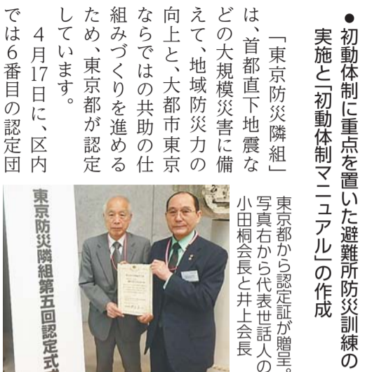
東京防災隣組第五回認定式

「東京防災隣組」は、首都直下地震などの大規模災害に備えて、地域防災力の向上と、大都市東京ならではの共助の仕組みづくりを進めるため、東京都が認定しています。 4月17日に、区内では6番目の認定団体として、津久戸小学校避難所運営管理協議会が認定されました。同協議会は、東日本大震災の際に多くの帰宅困難者が津久戸小学校に押し寄せた経験から、「帰宅困難者」を一時滞在施設等へ案内し、「避難者」を円滑に受け入れるための初動体制をつくることが重要と考え、検討を重ねました。その結果、独自の初動体制マニュアルを作成するなど、初動体制を整えた点が評価されました。 初動体制の整備に当たっては、防災訓練の内容や避難所運営管理上の課題を議論しました。また、初動体制に重点を置いた避難所防災訓練を実施し、学校の開校から避難所を立ち上げ、避難者を受け入れるまでの工程を細かく確認したほか、同協議会での議論等から課題を検証しました。これらのことを踏まえて初動体制マニュアルを作成するとともに、現在も定期的に訓練を実施するなど、継続してレベルアップを図っています。 【問合せ】危機管理課地域防災係(本庁舎4階) ☎(5273)3874・☎(3209)4069へ。