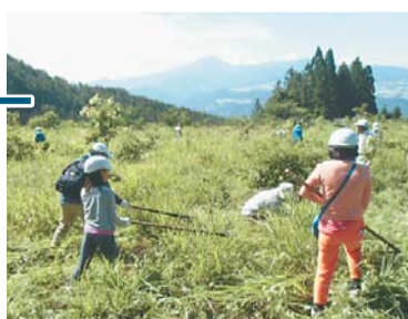
昨年の下草刈り(沼田)の様子

【問合せ】環境対策課環境計画係 (〒160-8484歌舞伎町1-4-1、本庁舎7階)☎(5273)3763・☎(5273)4070へ。