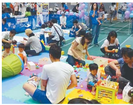
ブース出展「ママサークル活動紹介」

新宿シンちゃん(左) 新宿百人町明るい会商店街振興組合 キャラクター・同心くん(右)