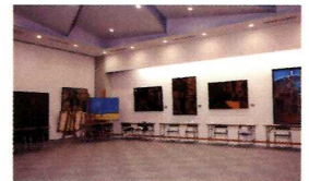
Campus Tour 27号館 地下2階 小野講堂