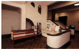
會津八一記念博物館 Tour 會津八一記念博物館入口