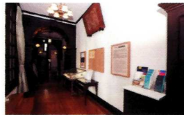
演劇博物館 Tour 演劇博物館入口