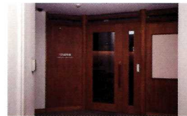
125記念室 Tour 26号館10階 125記念室入口