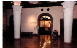
大隈記念室 Tour 會津八一記念博物館1階 大隈記念室入口