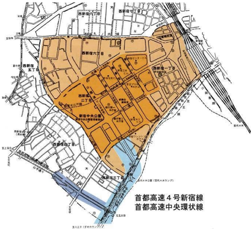
首都高速4号新宿線 首都高速中央環状線