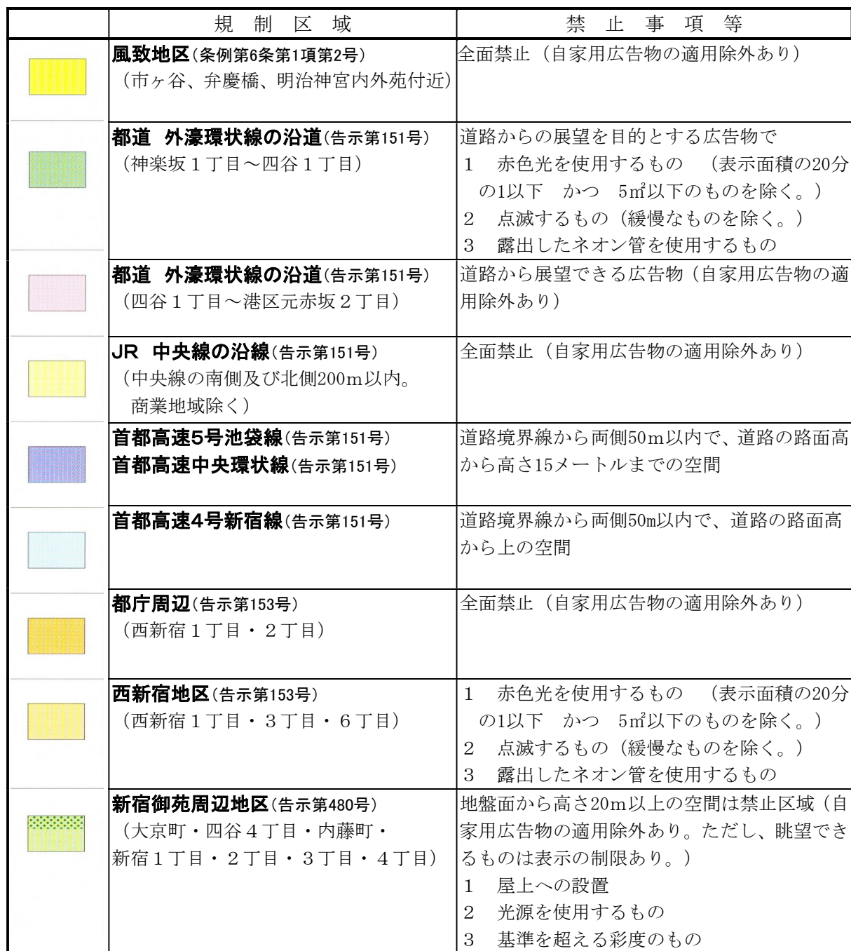
首都高速5号池袋線