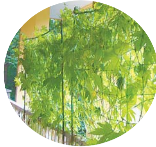
▶カーテン探検では、区内のみどりのカーテンを巡ってまち歩きをします

【問合せ】環境学習情報センター ☎(3348)6277・FAX(3344)4434へ。