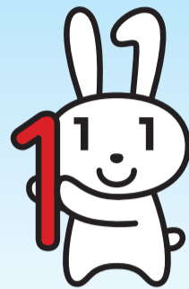
マイナンバー キャラクター 「マイナちゃん」

1月からマイナンバーの利用が始まり、さまざまな行政手続きで、マイナンバーの提示・報告が始まっています。区でマイナンバーを利用する主な手続きと、マイナンバーカード(個人番号カード)の交付申請の状況をお知らせします。