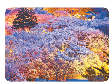
薄暮れに浮かぶ高遠城址公園

友好提携都市・長野県伊那市の高遠城址公園は、「桜の日本三大名所」の一つです。また、「日本さくら名所100選」にも選ばれ、「天下第一の桜」とも呼ばれています。 園内に咲き誇る約千500本の固有種・タカトコヒガンザクラは、小ぶりで赤みの強い色特徴です。 期間中は、高遠ばやしの巡行、篠笛の演奏等のイベントも開催されます。日没から午後10時ころまでは桜がライトアップされ、夜桜の幻想的な風景が広がります。 ●イベント情報 ▼篠笛の演奏: 4月11日(月)午前11時から・午後1時30分から ▼江戸かつぱれ: 4月14日(木)午前11時から・午後1時30分から ▼伊那のうまいもん大集合(ローメン、ソースかつ井、伊那餃子の販売): 4月9日(土)17日(日)午前10時から ▼みはらしマルシェ(伊那市の農産品や加工品販売): 4月11日(月)～17日(日)午前10時から ▼桜守ガイド: 4月7日(木)・8日(金)・14日(木)・15日(金)いずれも午前11時から・午後1時から。各回10組、予約制。 ▼夜桜思い出フォトプレゼン(プロのカメラマンが夜桜をバックに記念撮影): 4月7日(木)・8日(金)・14日(木)・15日(金) 10時～11時 伊那市では、自然や子育て・教育、歴史や文化などの魅力を発信するため「イーナ・ムービーズ なつかしい未来」をテーマに、プロモーション映像を制作しています(総合プロデュース・監督は柘植伊佐夫/伊那市芸術大使・人物デザイナー)。 JR東日本の電車内ビジョン「首都圏トレインチャンネル」で一部を紹介するほか、四季ごとの魅力をまとめた映像を特設サイト( http://i-namovies.jp/ )でも配信しています。ぜひご覧ください(通信費用は利用者負担)。