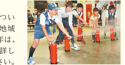
消火器での初期消火訓練