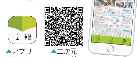
▲アプリアイコン ▲二次元コード