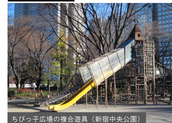
ちびっこ広場の複合遊具 (新宿中央公園)