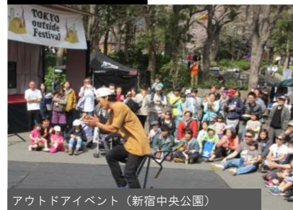
アウトドアイベント (新宿中央公園)