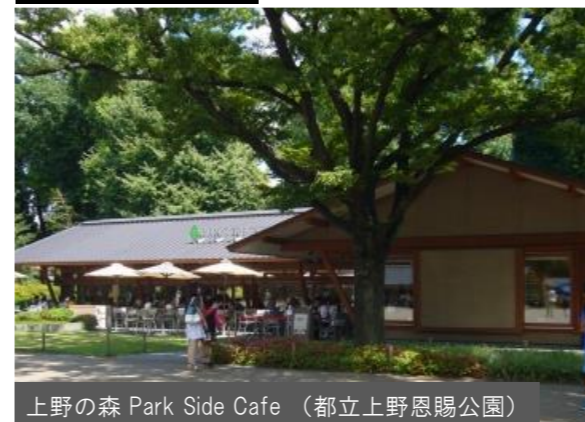
上野の森 Park Side Cafe (都立上野恩賜公園)