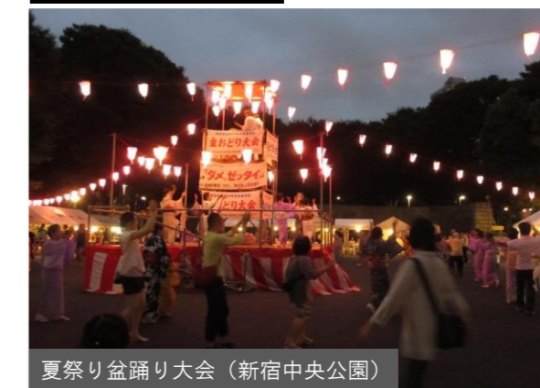
夏祭り盆踊り大会 (新宿中央公園)