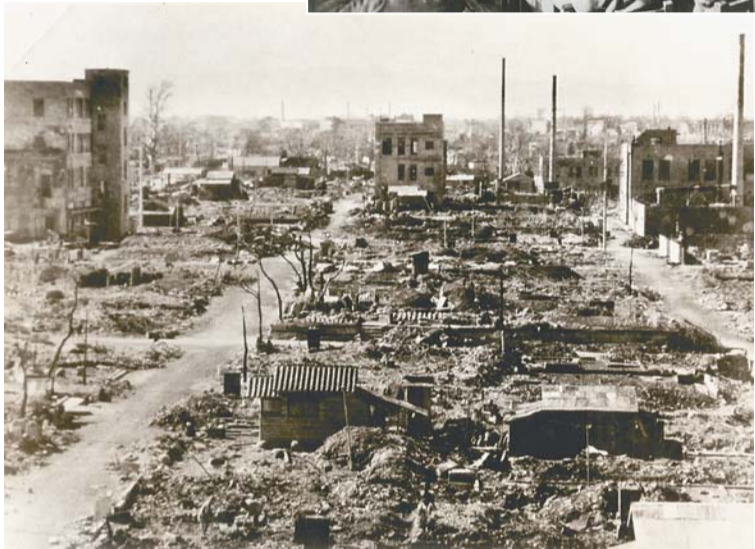
東京大空襲により被害を受けた鶴巻町付近(写真下)