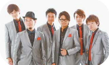
INSPI(アカペラグループ)