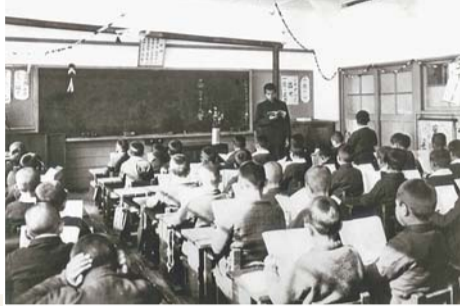
戦時中の授業風景 (写真右)

【問合せ】総務課総務係〒160・8484 歌舞伎町1-4-1、本庁舎3階 ☎(5273)3505・☎(3209)9947へ。