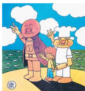
▲やなせたかしと平和展 絵本「あんばんまん」より (フレーベル館刊) ©やなせたかし