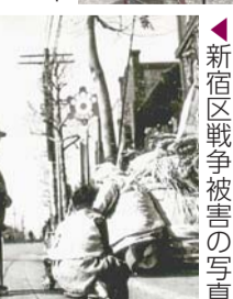
▲新宿区戦争被害の写真 (区役所本庁舎で)