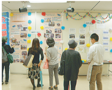
昨年のパネル展示

介護サービスを利用しての方や介護している家族、介護の現場で働く方を支援するとともに、地域での支えあいの輪を広げることが目指して、国は11月11日を「介護の日」としています。これにちなみ、区と新宿区介護サービス事業者協議会が「介護の日」の催しを開催します。当日直接、会場においでください。 【日時】10月23日(金)午前10時～午後4時 【会場】新宿文化センター(新宿6-14-1) 【主な内容】 ▼介護サービスを紹介するパネル展示