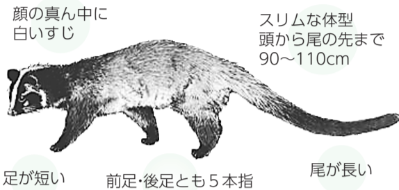
顔の真ん中に白いすじ スリムな体型 頭から尾の先まで90~110cm 尾が長い 前足・後足とも5本指 足が短い

剪定するなどの対策をしましょう。 ハクビシンなどを駆除します 区では、ハクビシン・アライグマがすみつけた民家を対象に、駆除を行っています。お困りの方は環境対策課公害対策係へご相談ください。