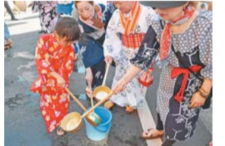
▲中落合一丁目みどり町会の皆さんが浴衣で打ち水

9月15日(火)まで、風呂の残り湯等を使った打ち水でまちを冷やす「新宿打ち水大作戦」を実施しています。皆さんも打ち水に参加してみませんか。道具は貸し出します。詳しくは、お問い合わせください。 【申込み】所定の実施計画書を郵送またはファックスで環境対策課環境計画係(〒160-8484歌舞伎町1-4-1、本庁舎7階) ☎(5273)3763・FAX(5273)4070へ。実施計画書は同係・環境学習情報センター(西新宿2-11-4、新宿中央公園内)・新宿リサイクル活動センター(高田馬場4-10-2)・西早稲田リサイクル活動センター(西早稲田3-19-5)・特別出張所で配布しています。新宿区ホームページからも申し込みます。