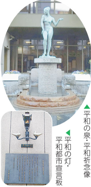
▲平和の泉 平和祈念像 ▲平和の灯 平和都市宣言板

※2面では、区に寄せられた戦争体験記を掲載しています。 【問合せ】総務課総務係(本庁舎3階)☎(5273)3505・☎(3209)9947へ。