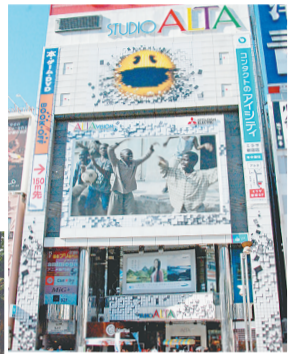
▲パックマンが新宿アルタを侵略中 ▼巨大ブロックアートが新宿モア4番街に登場