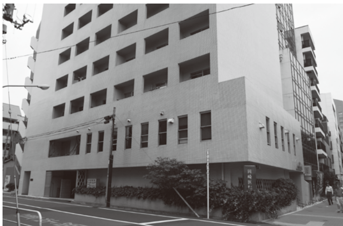
「太平洋戦争本土初空襲の地跡」として新宿区地域文化財に指定された現在の岡崎医院