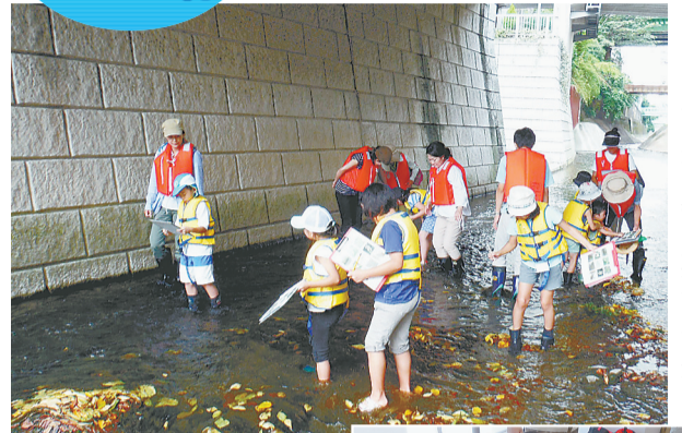
川の生き物や水草の調査