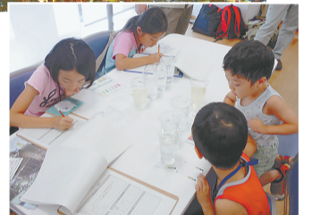
薬品を使って水質調査