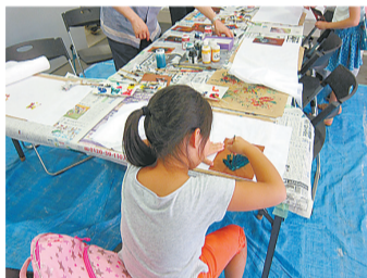
昨年の染色体験の様子