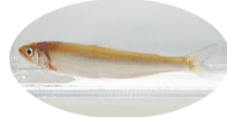
今年神田川で採れたアユ