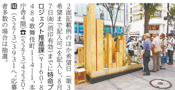
昨年のツアーの様子