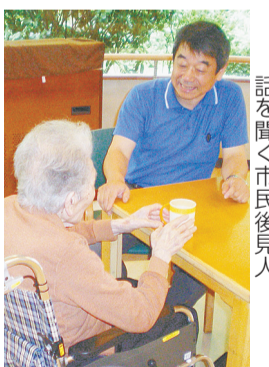
施設を訪問して被後見人の話を聞く市民後見人

【申込み】電話かほかき・ファックス(4面記載例のほか希望日を記入)または直接、①は7月27日②は8月5日(必着)までに地域福祉課福祉計画係(〒160-8484歌舞伎町1-4-1、本庁舎2階) ☎(5273)3517・FAX(3209)9948へ。各日先着30名程度。