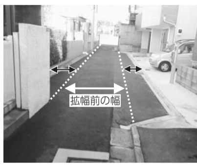
拡幅整備の例(←→は拡幅部分)

● 建築確認申請の前に事前協議が必要です 建築主は、幅が4m未満の区道に接している建物を建て替える際には、「新宿区細街路拡幅整備条例」に基づき、区との事前協議が必要です。 建築主は、建築確認申請の30日前までに、事前協議書を建築調整課へ提出してください。事前協議の合意後、後退した部分は原則として区が拡幅整備します。 ● 個別訪問を行っています 幅が4m未満の区道に接する