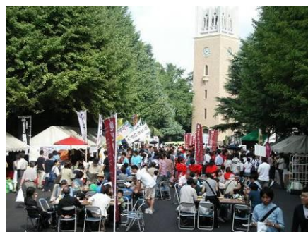
早稲田地球感謝祭 2013

毎年9月に早稲田キャンパスを主会場として開催される地球感謝祭は、イベントをきっかけにまちを変えていくというコンセプトのもとに開催され、3万人を越す来場があります。