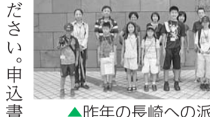
▲昨年の長崎への派遣から

【費用】交通費・宿泊費は無料(食事代の一部は各自負担) 【申込み】所定の申込書(裏面の原稿用紙に「平和派遣参加に期待すること」をテーマとした親の作文(500字程度)を記入を、5月7日(水)～21日(水)に総務課総務