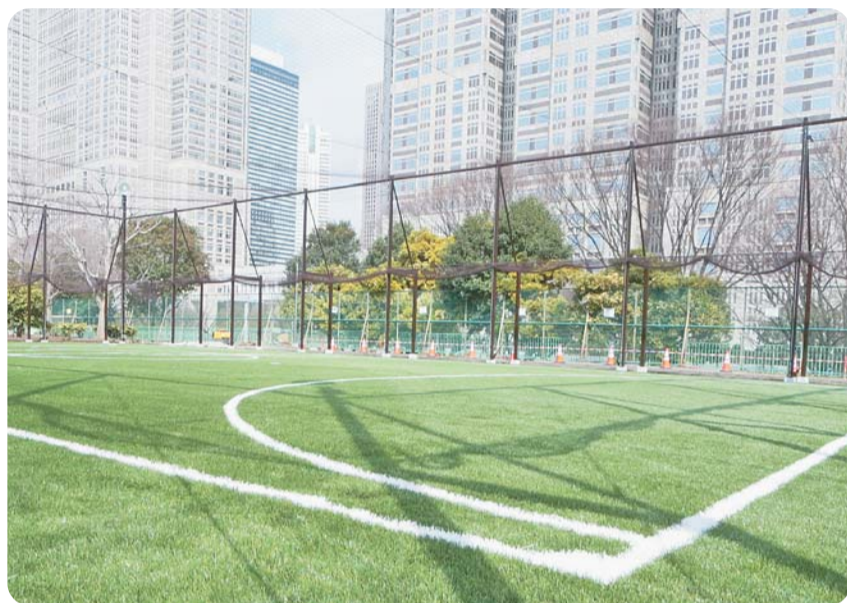
高層ビル群に臨むフットサルコート