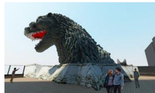
歌舞伎町に出現するゴジラヘッドイメージ図