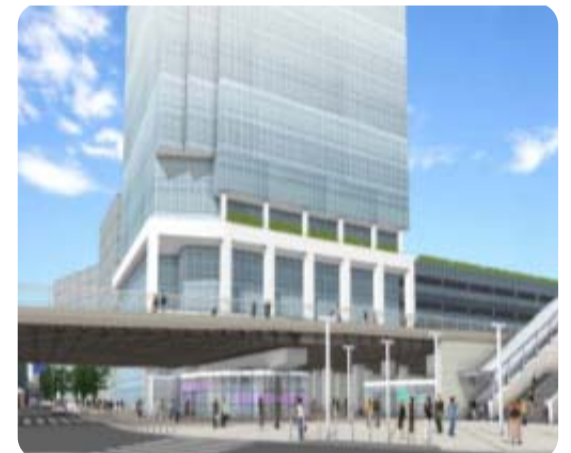
平成28年度 オープン