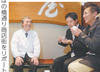
あけぼの橋通り商店街をレポート