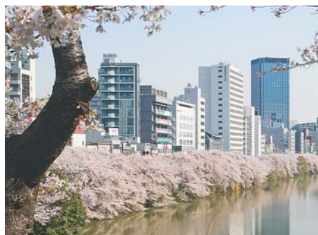
外堀通り沿いの桜

江戸のまちの大半を消失した「明暦の大火」の翌年(1658年)には、新たな消防制度として、現在の市谷左内町、市谷田町1丁目地内に定火消(じょうびけし)の第1号が置かれました。2,300坪もの広大な屋敷内には火の見やぐらが建てられ、役人のほか火消人足約100名が常駐し、火事に備えていました。