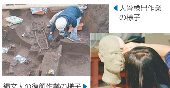
人骨検出作業の様子

出土した土器や縄文人の復顔像などは、3月8日(日)から新宿歴史博物館(三栄町22)で開催する特別展「新宿に縄文人現る」で紹介されます。