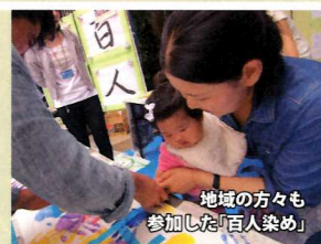
地域の方々も参加した「百人染め」

一反の白い布地を地域のお祭りや小学校での授業の一環として染めました。完成した作品は当日、川のギャラリーの一部として展示します。