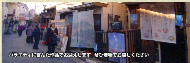
バラエティに富んだ作品でお迎えます。ぜひ着物でお越しください