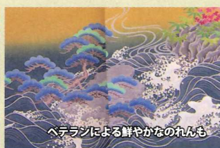
ペテランによる鮮やかなのれんも