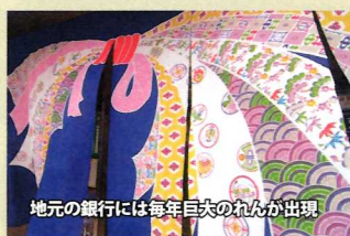
地元銀行には毎年巨大のれんが出現