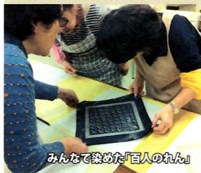
みんなで染めた「百人のれん」