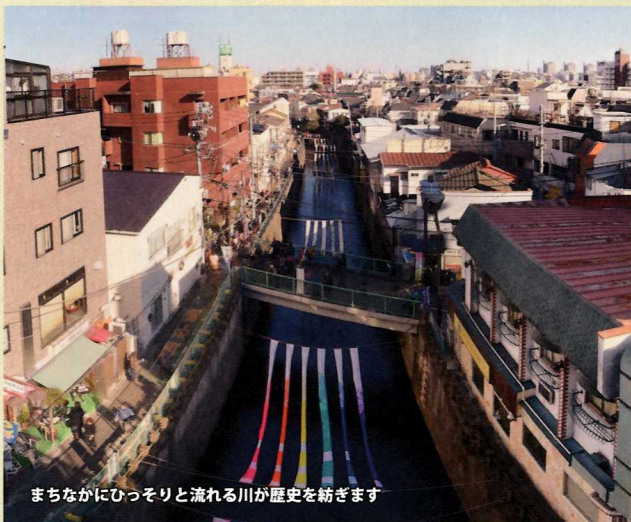
まちなかにひっそりと流れる川が歴史を紡ぎます

江戸文化が醸成した染色の技術。継承する染工場の職人たちが川のあちこちで染め物の水洗いをする風景は、昭和30年代まで落合・中井の風物詩でした。色とりどりの反物を川面に架け渡すことで、当時の街の記憶を現代に甦らせます。