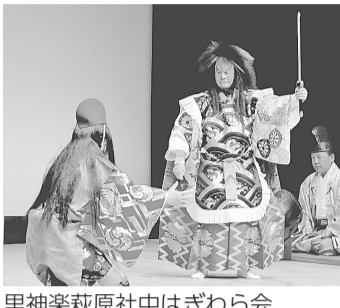
里神楽萩原社中はぎわら会

神楽と囃子(はやし)は、民俗文化財保持団体「お神楽とお囃子」が、祭礼の際に神社の神楽殿などで行われる演舞で、一般に公開される機会が限られています。この機会に、郷土色豊かな民俗芸能を堪能ください。