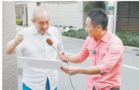
まちの移り変わりをレポート

※ケーブルテレビの受信については、ジェイコム港・新宿 ☎0120(914)000へ。