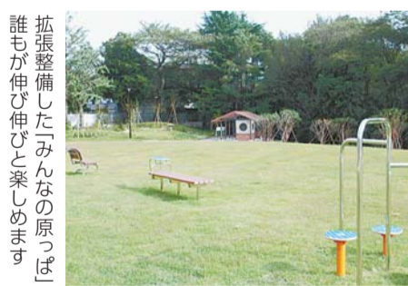
拡張整備したみんなの原っぱ 誰もが伸び伸びと楽しめよう

24年度から始めた拡張整備工事が完了し、いよいよ明日10月26日(日)、全面開園します。記念フェスタも実施します(午前10時～午後3時30分)。人と自然がふれあう、21世紀の里山としての魅力を体感できる公園です。この土地が持つ豊かな自然や歴史の記憶を感じてみませんか。