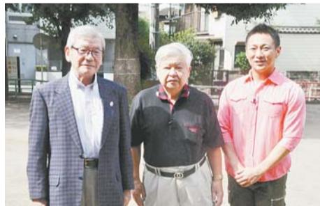
地域で活動する皆さんが登場