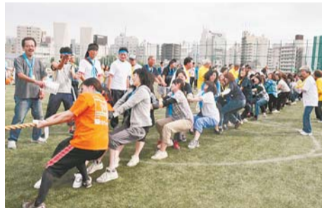
落合第一地区運動会～皆で力を合わせます

【問合せ】区政情報課広報係(本庁舎3階) ☎(5273)4064・FAX(5272)5500へ。