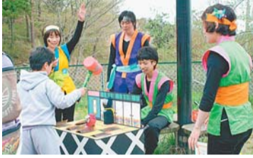
▲さまざまなゲームに挑戦

▶子どもたちのダンス発表(午前11時20分～11時40分、午後2時30分～2時40分)ほか