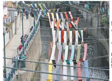
妙正寺川を彩る 色とりどりの反物