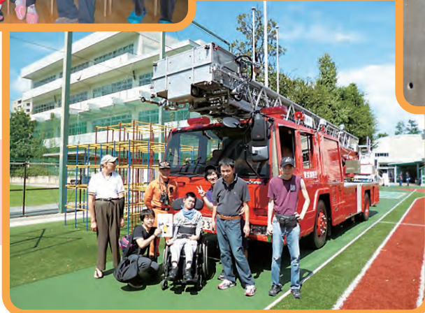
地域のイベント参加の様子