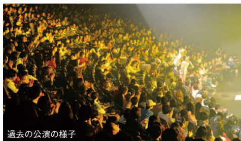
過去の公演の様子

【料金】(前売) 全席指定 一般 S席6,500円 A席5,000円 B席4,000円 子ども S席3,500円 A席2,500円 親子ペア S席8,500円 一般3名セット S席17,400円 学生 3,500円