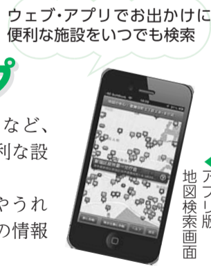
ウェブ・アプリでお出かけに便利な施設をいつでも検索