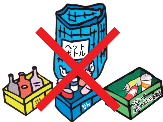
街角に出るコンテナ・ネット (回収拠点)