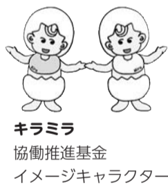
キラミラ 協働推進基金 イメージキャラクター

募集期間は、5月20日(火)～6月25日(水)です。 次の①～⑩の書類を地域調整課管理係へお持ちください。郵送では申し込みできません。①協働事業提案書、②事業提案企画書、③事業収支予算書、④団体概要書、⑤団体の定款・規約・会則等、⑥役員・会員名簿、⑦25年度活動報告書、⑧25年度収支計算書またはそれに準ずるもの、⑨その他団体の活動内容がわかるもの(チラシ・パンフレットなど)、⑩確認シート