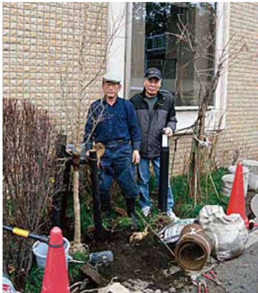
地域センター玄関脇の花壇に 榎を植樹しました