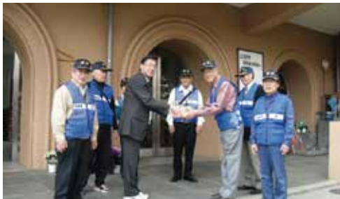
早稲田小学校にて