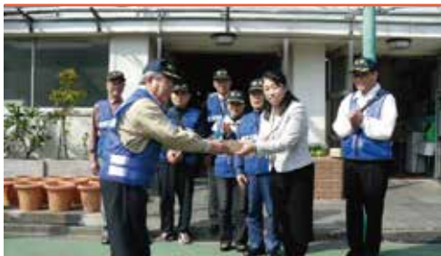
江戸川小学校にて

今年度は、「青色防犯パトロール（子ども見守りパトロール）」を重点的に地域の子どものためのびのびと元気に登下校できる安全安心な複地区を作り上げていきたいと思っております。