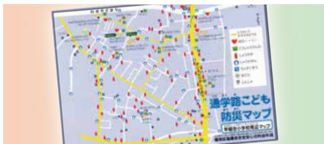
通学路防災マップ