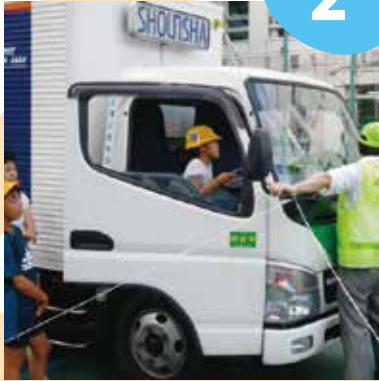
運転席からはどのように見える?