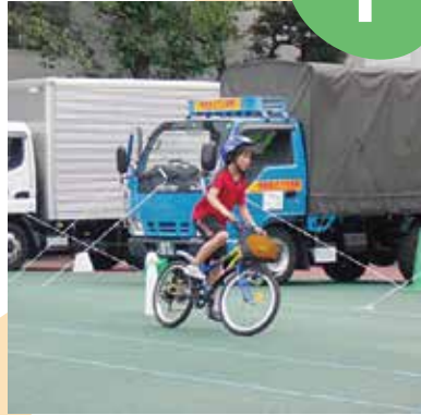
S字クランクに挑戦!