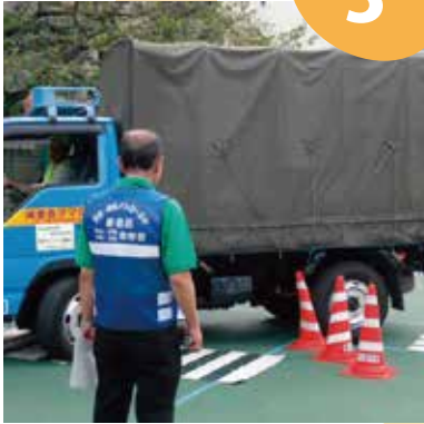
トラックが左折するとコーンを巻き込んだ!