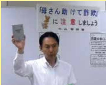
この機器で詐欺電話を撃退