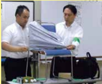
自転車荷台カバーの説明

7月9日は「詐欺の手口」と題し、牛込警察署生活安全課の警察官が詐欺の手口を実例の音声テープも交えて分かりやすく説明して下さいました。