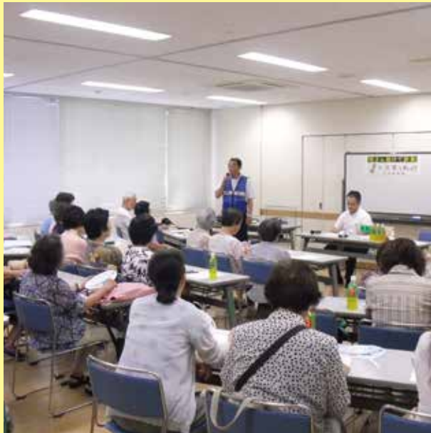
熱心に聞き入る参加者たち