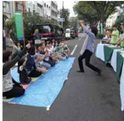
▲踊る?コンダクター

いつもお願いしている「早稲田ノエルズ」の皆さんに演奏をしていただきました。演奏を見たり聞いたりするだけではなく、参加した皆さんも本物の楽器「ハンドベル」を持ち、実際に演奏しました。ちゃんと音は出ましたよ。 今回は中国の語学留学生4人も参加してくれて、とても楽しそうでした。音楽は国境を超えるということを身近に感じたひとときでした。