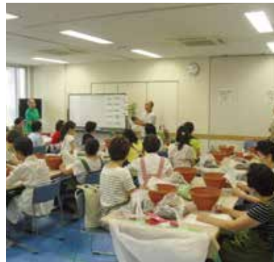
一つひとつの花苗の説明に聞き入る参加者