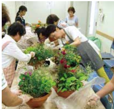
こんな感じでいいかしら？