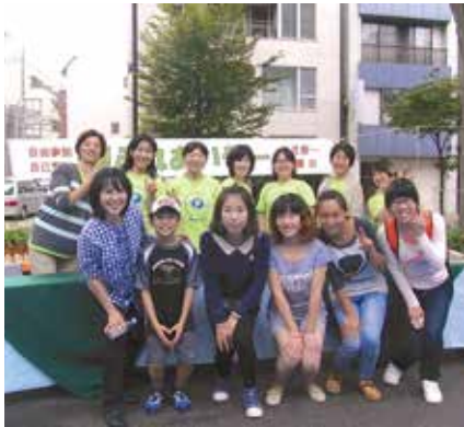
▲国境を越えた交流にハイパチリ

いつもお願いしている「早稲田ノエルズ」の皆さんに演奏をしていただきました。演奏を見たり聞いたりするだけではなく、参加した皆さんも本物の楽器「ハンドベル」を持ち、実際に演奏しました。ちゃんと音は出ましたよ。 今回は中国の語学留学生4人も参加してくれて、とても楽しそうでした。音楽は国境を超えるということを身近に感じたひとときでした。