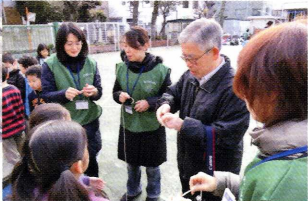
うまくコマが回せるかな？