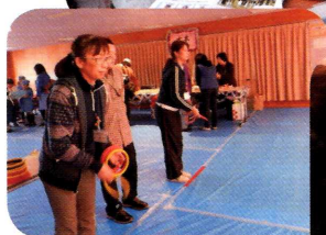
5階のコンドルでは、 ゲームコーナーで子 どもも大人も輪投げ を楽しみました