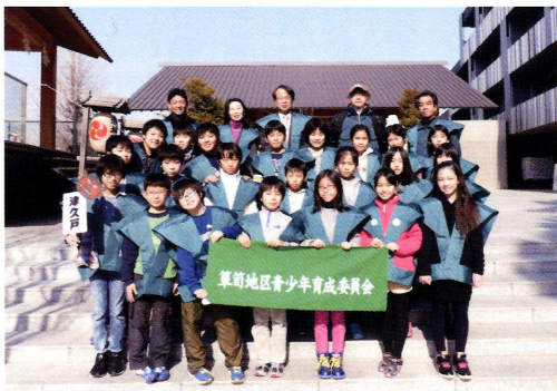
津久戸小学校 5年1組