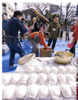
お父さんたちと子どもたちももちつき

最後におやじの会のみなさんが用意した、美味しい雑煮をいただきました。あっという間に食べ終えて、お代わりの列に並んでいる子ども達の笑顔に、多少体のあちこちが痛くても、「来年もがんばってもちをつくぞ!!」とお父さん達も満足そうでした。(1/18 PTA 主催)