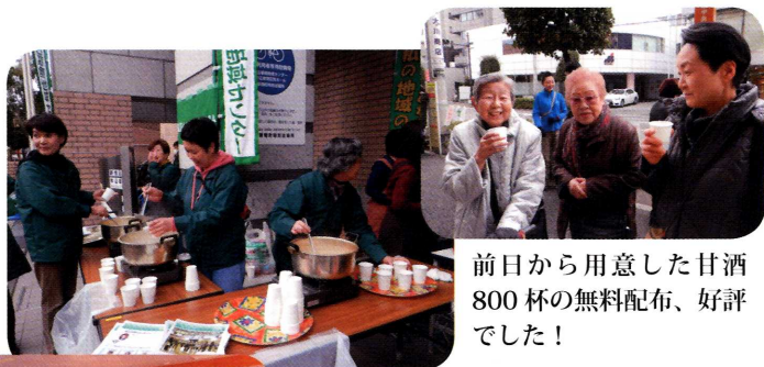
前日から用意した甘酒 800杯の無料配布、好評 でした！

1月29日(日)、にぎやかに牛込筆筒地域まつりが開かれ、育成会は「甘酒配布」「子どもゲームコーナー」「パネル展示」に協力をしました。みなさん、美味しく！楽しく！過ごされましたか？