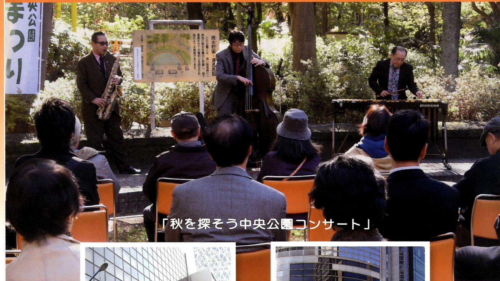
「秋を探そう中央公園コンサート」