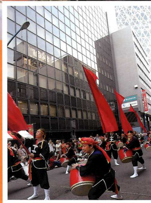
「新宿エイサーまつり(西新宿演舞会場)」