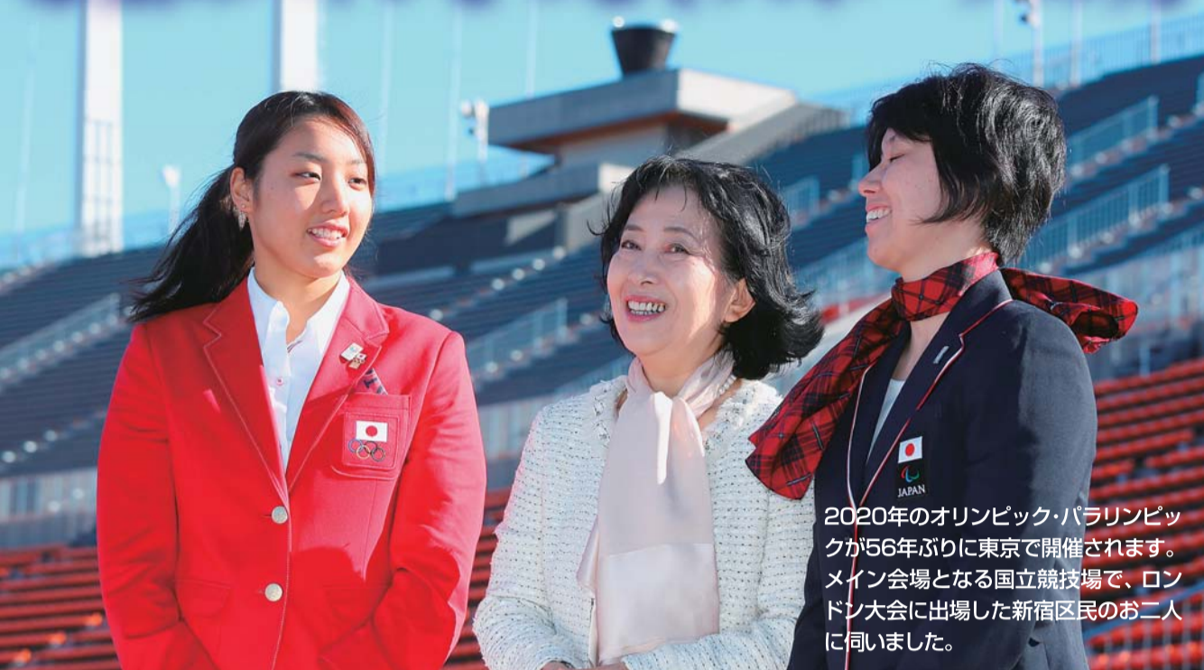
2020年のオリンピック・パラリンピックが16年ぶりに東京で開催されます。メイン会場となる国立競技場で、ロンドン大会に出場した新宿区民のお二人に伺いました。