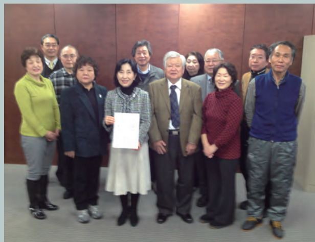
▲区長へのまちづくり構想の提言の様子

「都心共同住宅供給事業」「耐震化支援事業」「細街路拡幅整備事業」など既存の支援事業の活用を総合的かつ重点的に働きかけていきます。