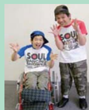
<脳性マヒブラザーズ>