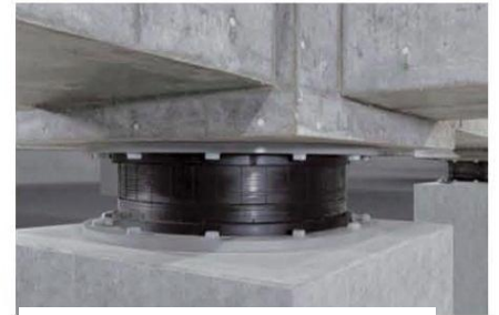
免震装置イメージ(積層ゴム)